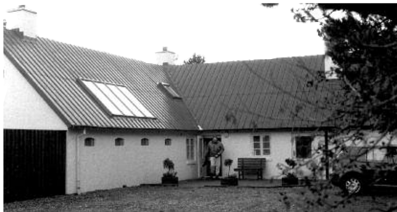
Lille Skiveren