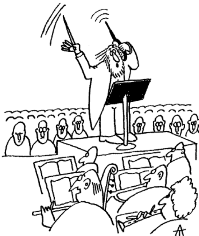
Tegning: Klaus Albrechtsen

grad – professionelle kor og ensembler. Kernekompetencen er evnen til at lede ensembler, hvis forskellige sammensætning skal afspejle musikskolernes og amatørmusiklivets virkelighed, samt evnen til at organisere og strukturere prøve- og koncertforløb med ikke-professionelle medvirkende.