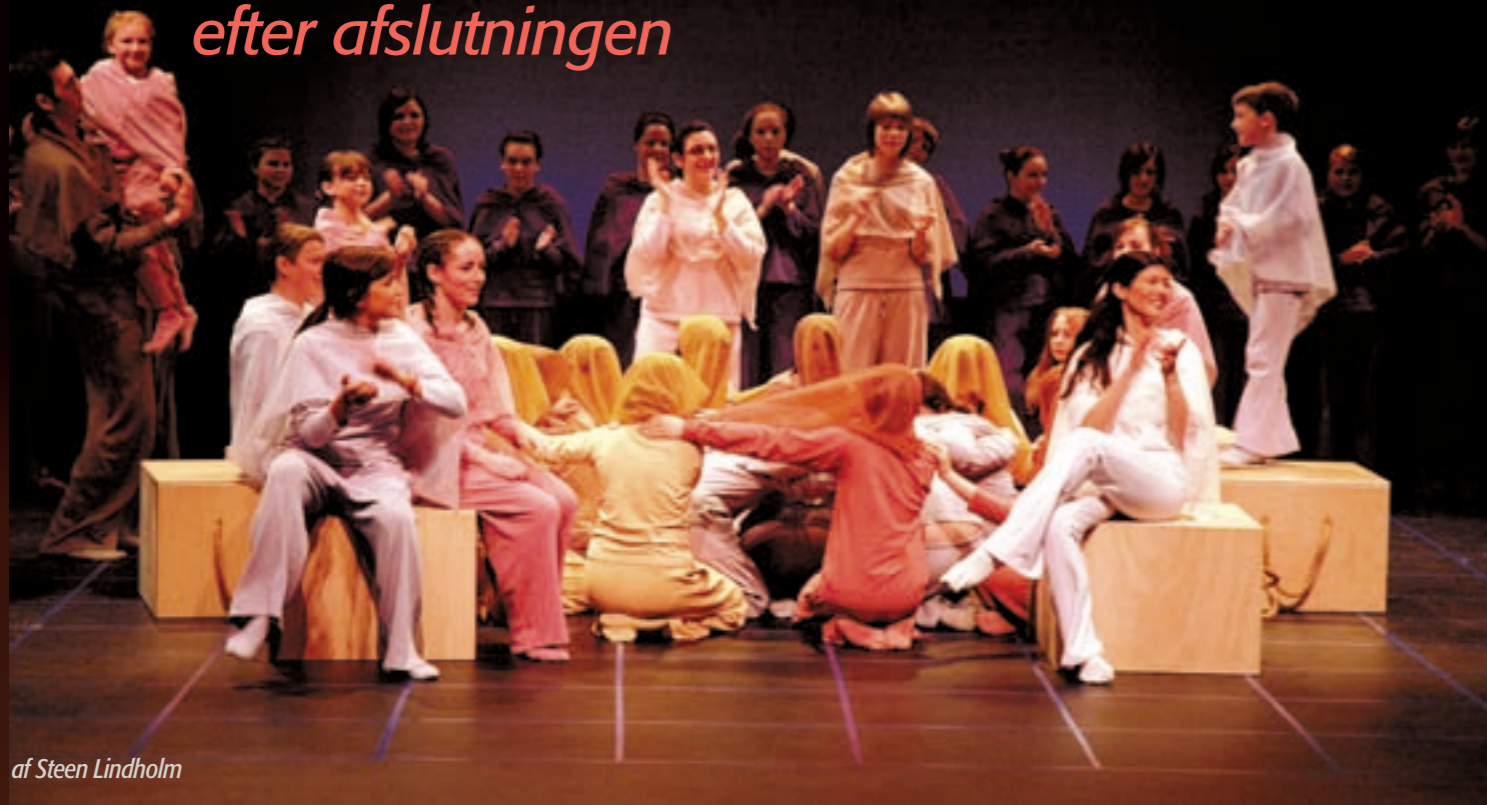
af Steen Lindholm

Hvordan gik det så med Verdenssymposiet for kormusik, som vi afholdt 19.-26. juli i København, med et væld af begivenheder i Operaen på Holmen samt i Københavns koncertsale og kirker?